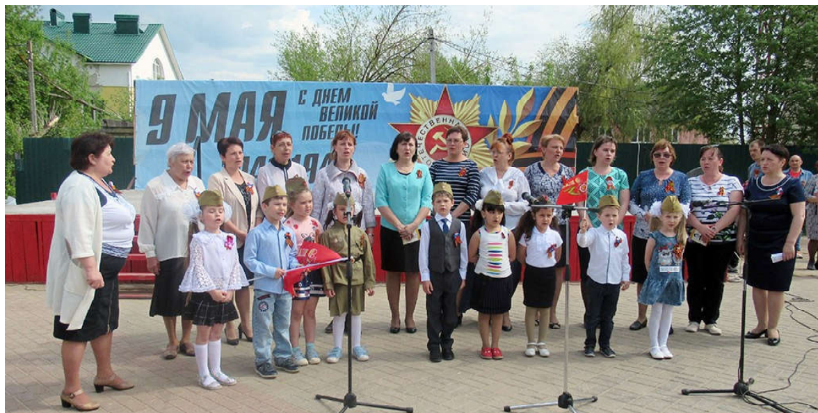
На снимках: поет коллектив детского сада «Улыбка»; хор администрации района.